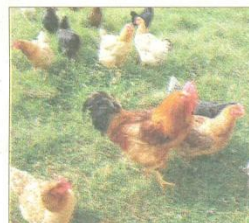
Pas de ferme sans basse-cour, avec, en prime, la recherche des œufs, très prisée par les hôtes les plus jeunes.

« Les gens choisissent de passer un week-end ou des vacances dans une roulotte pour l'originalité de l'hébergement, la vie à la ferme, le dépaysement ».