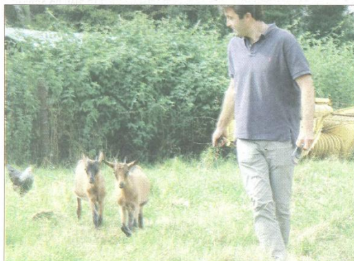
L'une des attractions préférées des enfants : les deux chèvres naines de la ferme.