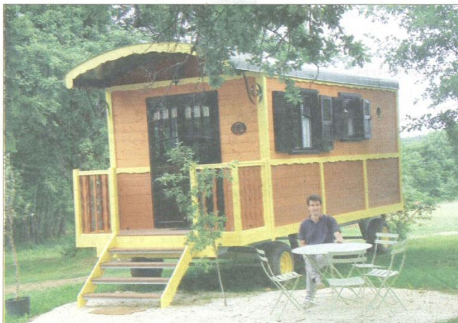
Yannick Gonzalez devant l'une des trois roulottes "immobiles" de la ferme de Sirguet.

Les trois roulottes, différenciées par la couleur de leur rambarde et de leur salon de jardin, sont disposées sous les frondaisons autour d'un îlot central engazonné. Trois petites cabanes pour