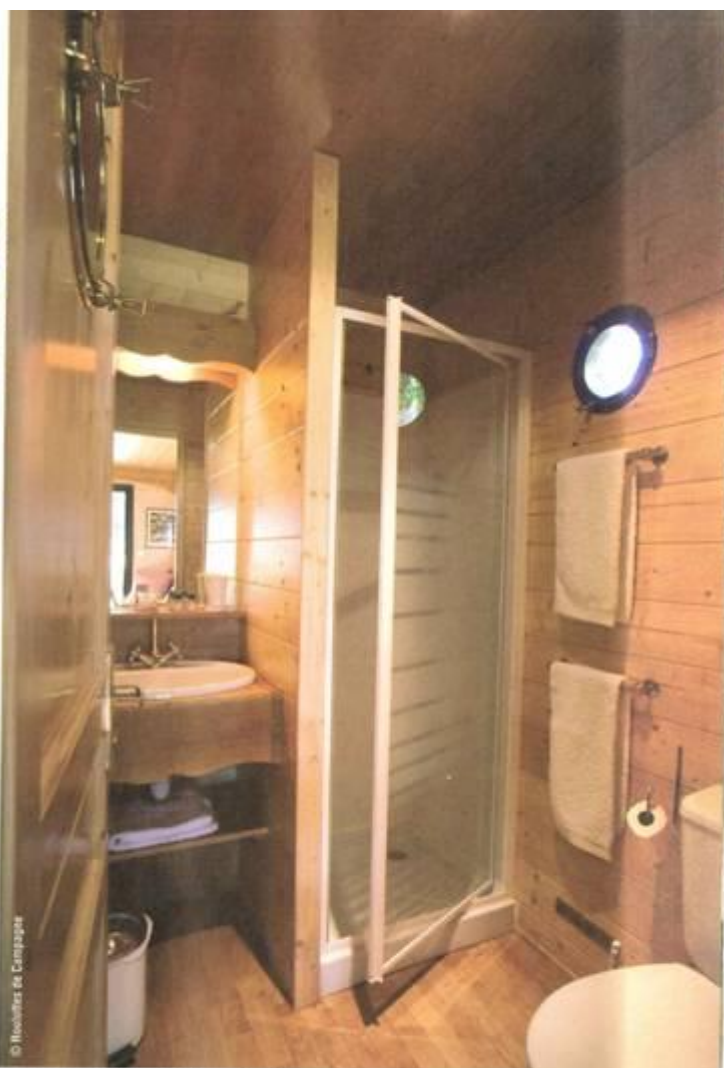
Le soin de prestations hôtelières classiques, un équipement moderne, une décoration simple : les Roulettes de Campagne mettent tous les atouts de leur côté pour séduire.