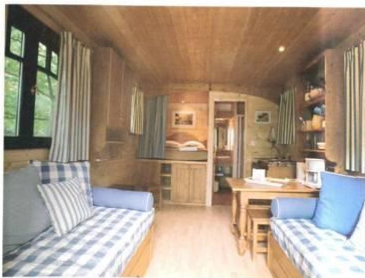
Un cocon chaleureux et naturel, pour un séjour tout confort.